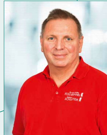
Andreas Schlüter Chirurgie

Alter Postplatz 2 71332 Waiblingen Telefon: 07151 1722-21/-24 E-Mail: info@doc-reichmann.de www.doc-reichmann.de